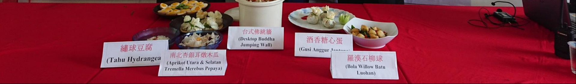
繡球豆腐 (Tahu Hydrangea)