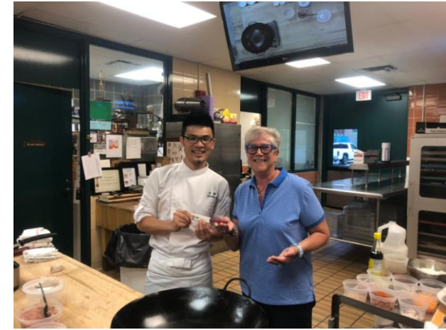
現場交流互動贈送 小刀一把