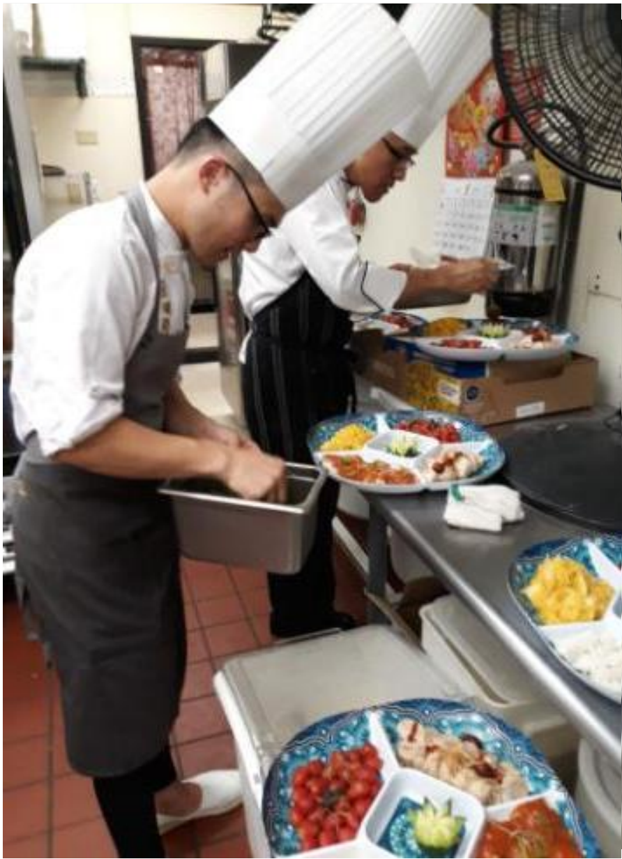
臺灣辦桌文化，餐廳準備出菜中