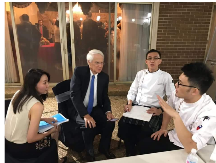
駐亞特蘭大臺北經濟文化處liz領事 與美國記者訪問臺灣美食