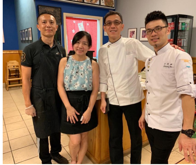
JJ Café 臺商餐廳年輕 老闆及老闆娘合影