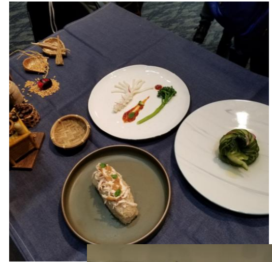
安那堡 圖書館 現場展 演菜餚 及工作 人員