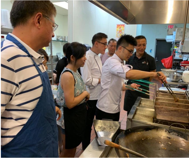
JJ Café 臺商經營餐廳 諮詢與《深夜鹽酥雞》 示範交流

2019 NC Taiwanese Culinary Arts Tour 北卡-North Carolina