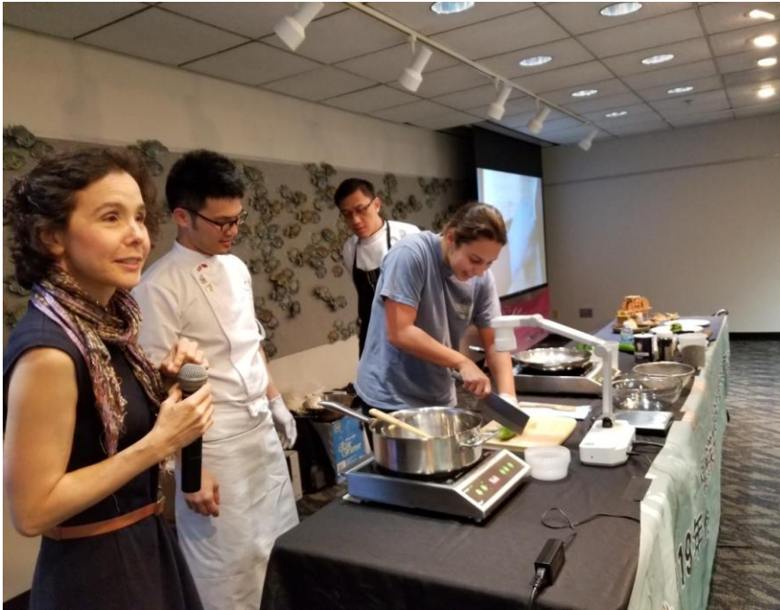
現場與外國朋友互動臺灣刀工 技術交流，蓑衣黃瓜示範