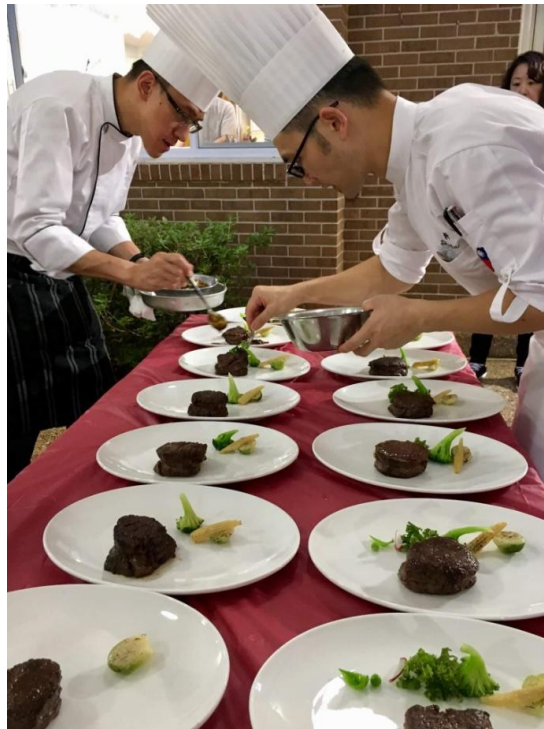
出菜中、與工作人員實況合影