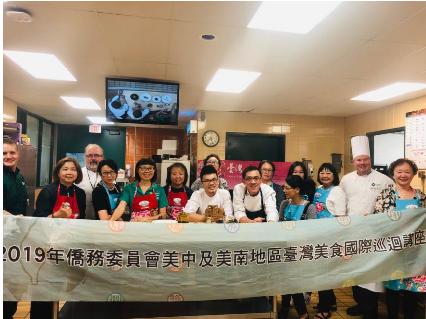
密西根奧克蘭餐飲學院示範教學 老師及工作人員合影