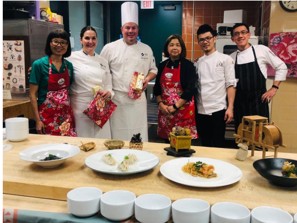
密西根奧克蘭餐飲學院系主任 、老師及密西根人文協會會長與 兩位講師合影