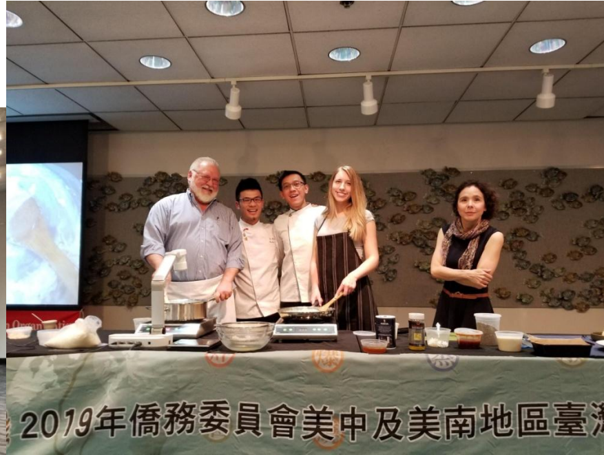
現場教學示範與外國朋友分享 互動臺灣佳餚-私藏豆腐麻糬 五味小鱸魷、糖醋蓑衣黃瓜