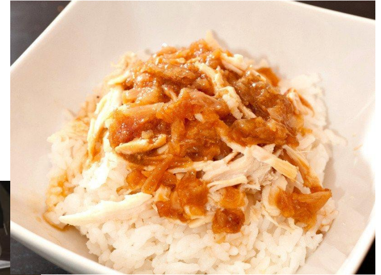
與臺商經營餐廳分享交 流嘉義雞肉飯