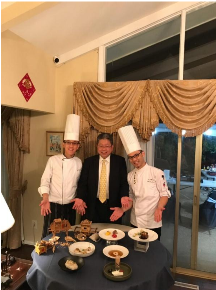
駐亞特蘭大臺北經濟文化處 劉處長與兩位講師合影