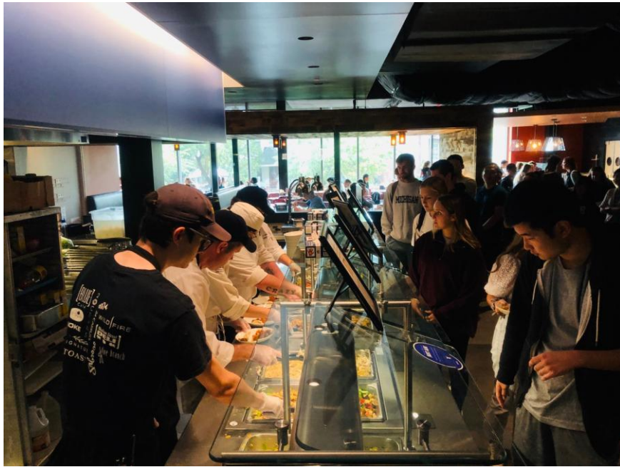
密西根大學學生品嚐分享中。