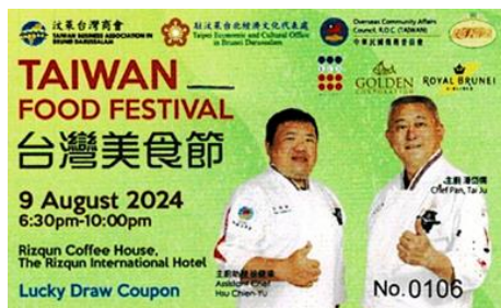
圖說：臺灣美食節餐卷

教學菜單：臺式炒芥蘭 白菜滷 蔥油餅 寶島牛肉麵 澎湖黑糖糕 豆腐花 芋頭西米露 臺灣剉冰 蛋塔 黃金芝麻球 地瓜球 綜合水果盤 咖啡及茶 珍珠奶茶