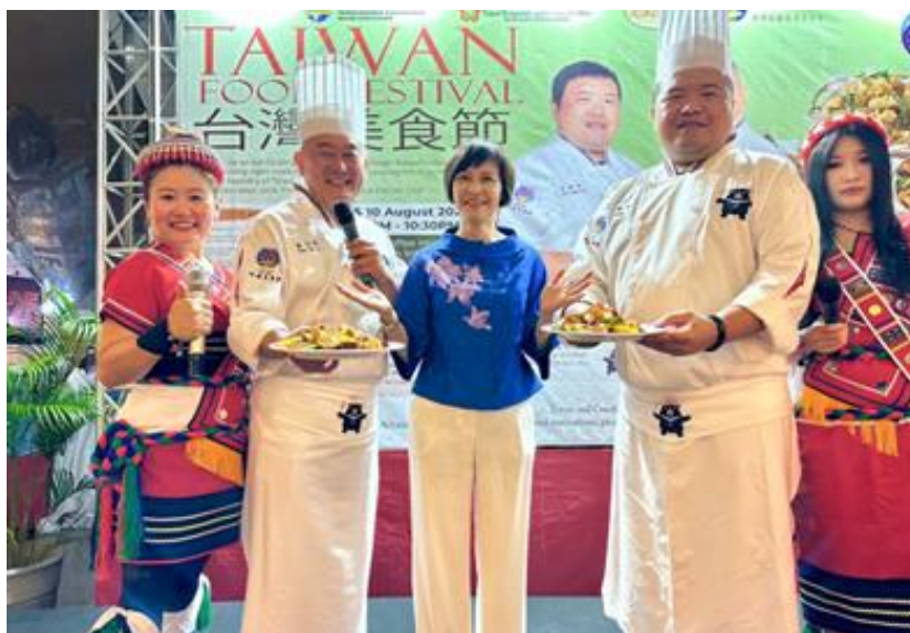
圖說：宮保雞丁成品