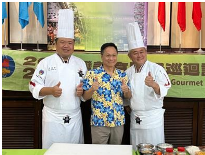
圖說：講師與駐館長官合影