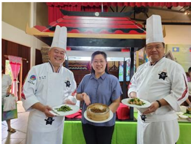
圖說：講師與駐館長官合影