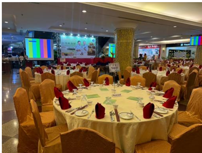
圖說：活動現場準備

教學菜單：涼拌小黃瓜 五香茶葉蛋 家常滷味盤 川味口水雞 五味中卷 臺式海鮮羹 嘉義雞肉飯 臺灣鹹酥雞 宮保鮮蝦球 黑胡椒牛肉 宮保雞丁 糖醋鮮魚片 臺式炒芥蘭 白菜滷 蔥油餅 寶島牛肉麵 澎湖黑糖糕 豆腐花 芋頭西米露 臺灣剉冰 蛋塔 黃金芝麻球 地瓜球 綜合水果盤 咖啡及茶 珍珠奶茶