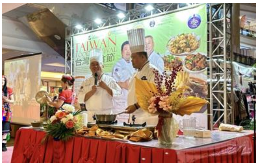
圖說：現場示範教學