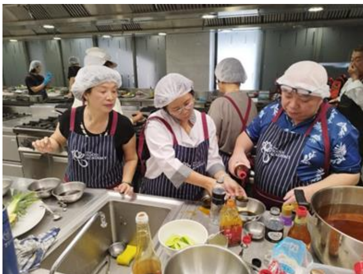
圖說：學員實際操作