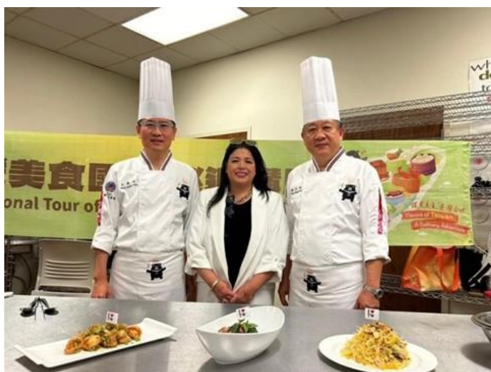
圖說：與主辦僑團合影