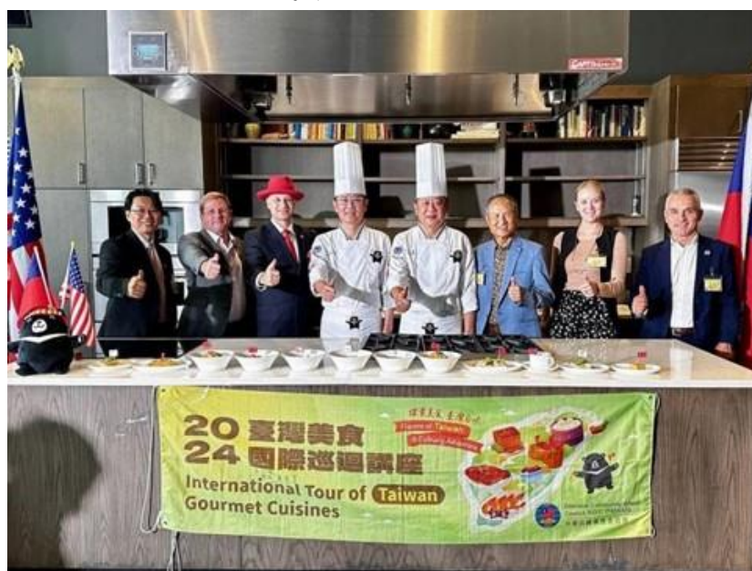
圖說：與會貴賓合影