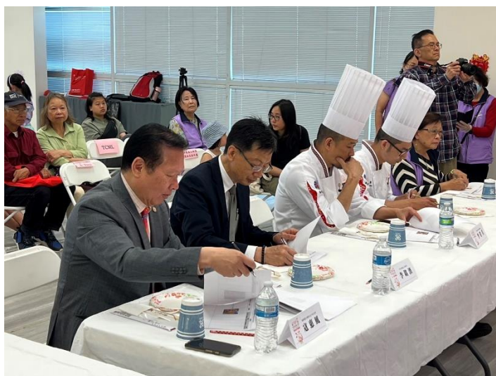
圖說：擔任母親節廚藝大賽評審