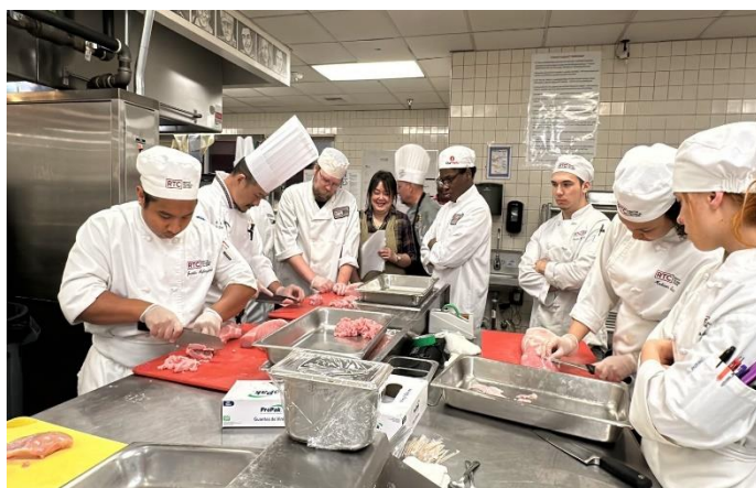
圖說：教學及材料準備