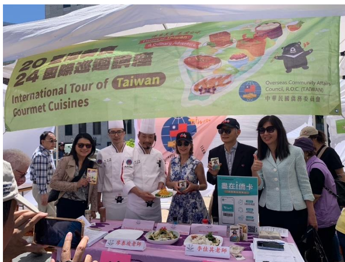
圖說：向主流貴賓推廣臺灣美食