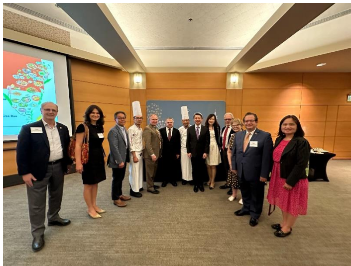
圖說：教學示範活動結束與外賓政要合照