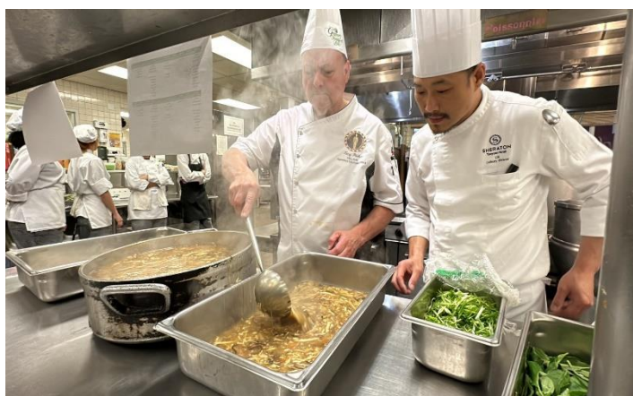
圖說：活動餐點製備

教學菜單：豆乳臺灣鹹酥雞 酥炸地瓜球 奶茶 黑胡椒牛肉 寶島三杯杏鮑菇 經典酸辣湯