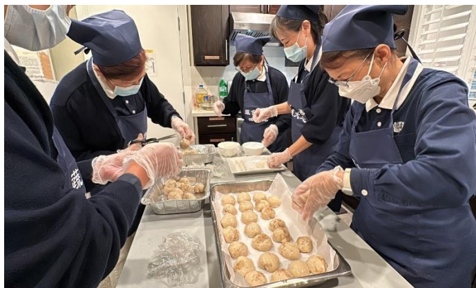
圖說：活動餐點製備