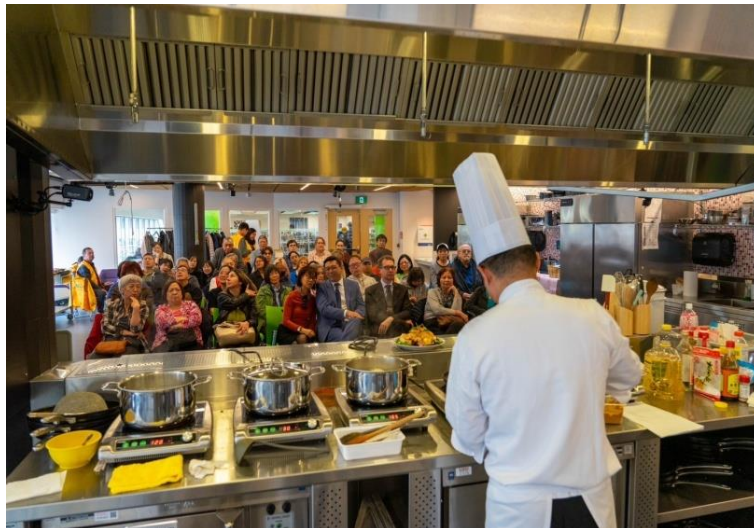
圖說：示範教學現場