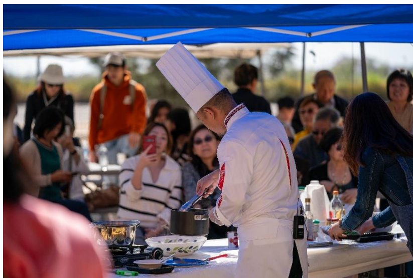
圖說：教學現場盛況

教學菜單：老酒晶凍醉鮮蝦 蒜味赤肉羹 麻油雞飯 豆乳臺灣鹹酥雞 桃禧香濃紅燒牛肉麵