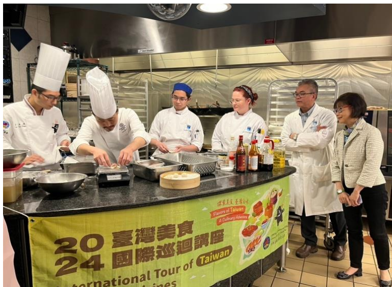
圖說：教學互動過程