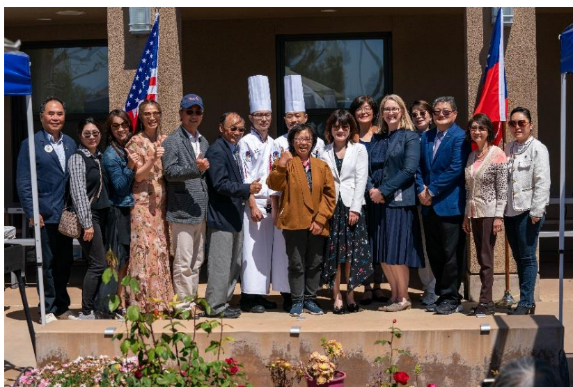
圖說：講師與主辦單位合影