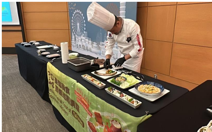
圖說：教學現場示範