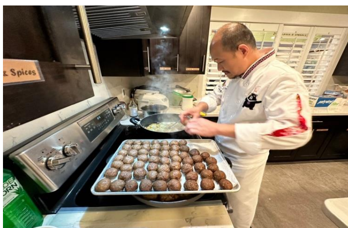
圖說：活動餐點製備