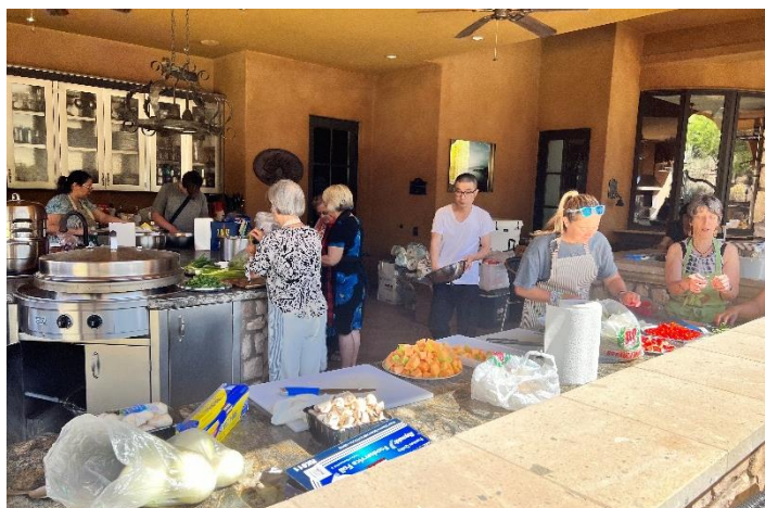
圖說：講師與內場與志工們製作臺灣美食