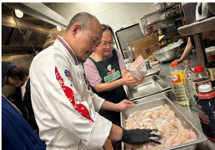
圖說：講師與內場與志工們製作臺灣美食