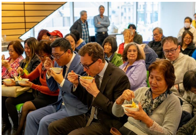
圖說：教學餐點品試