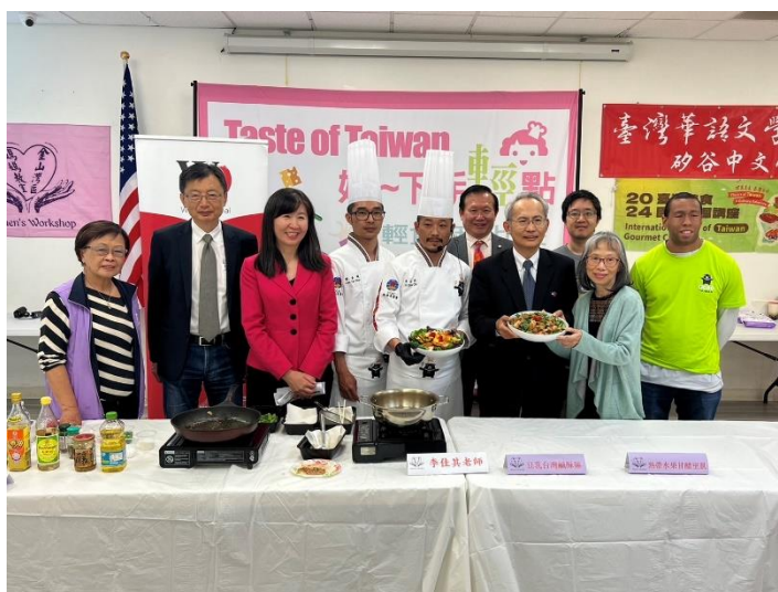
圖說：示範教學後合影