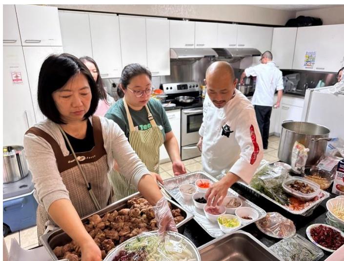
圖說：講師與內場與志工們製作臺灣美食