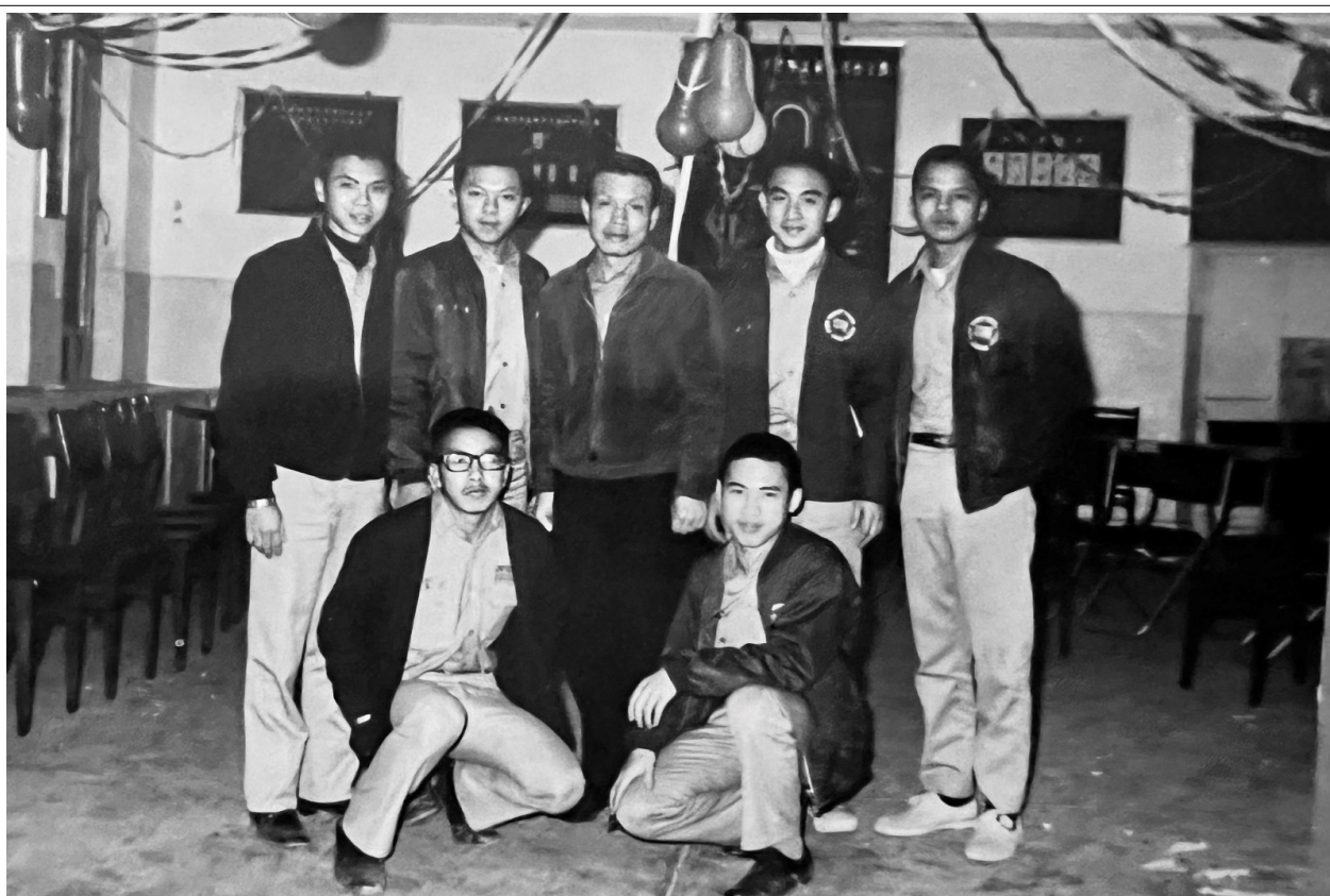
民國六十二年春節聯歡晚會後部分僑生與譚教官合照