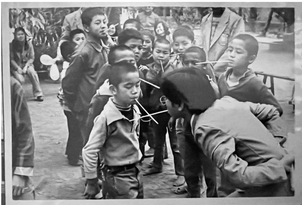
華光合唱團團員慰問孤兒院與小朋友一起進行遊戲同樂