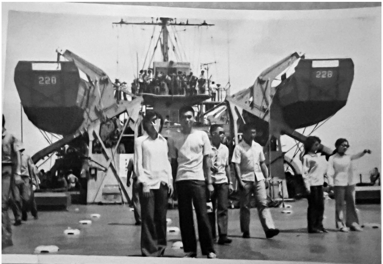
各院校學員搭乘救國團主辦之 澎湖戰鬥營 軍艦 前往澎湖