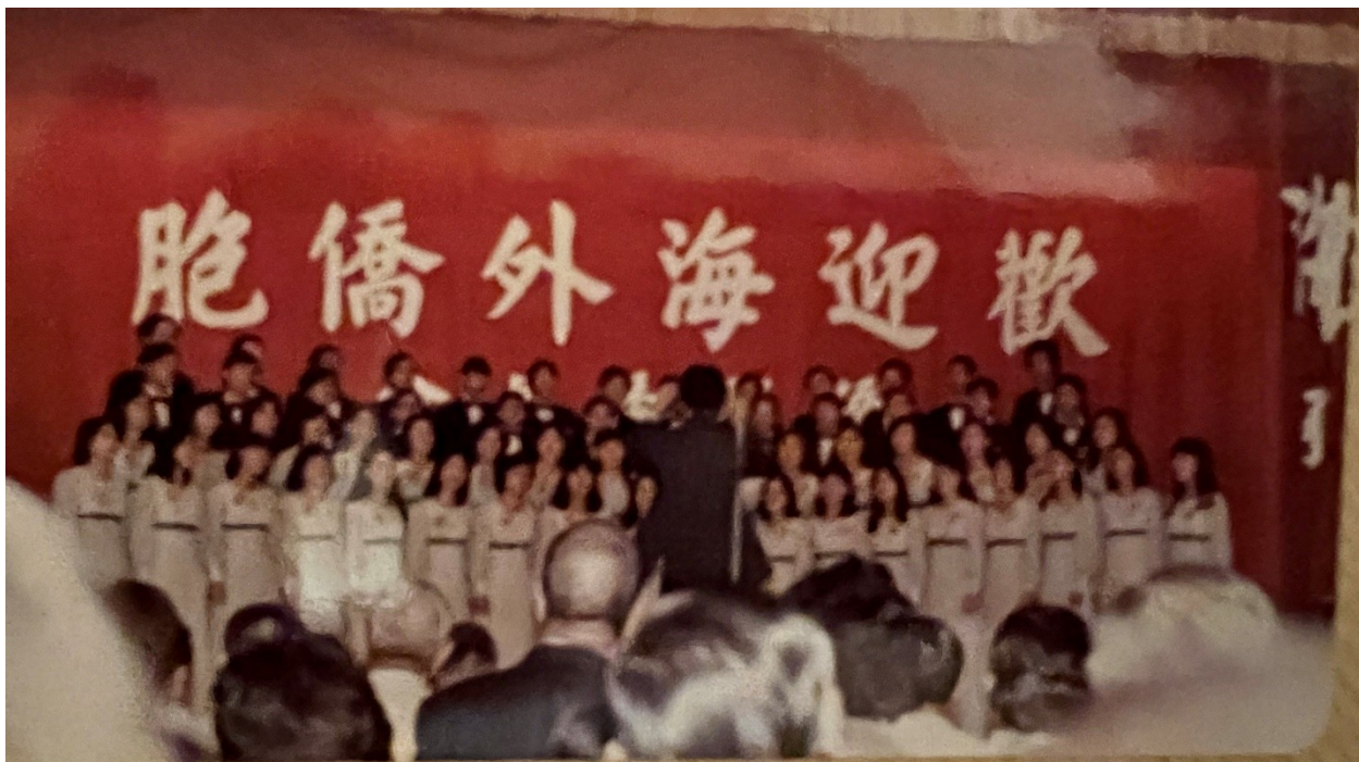
華光合唱團在雙十國慶節僑委會歡迎海外僑胞晚會上演唱