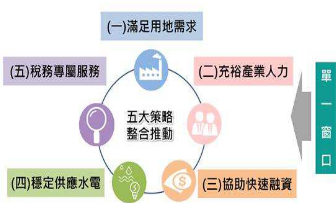
五大策略整合推動