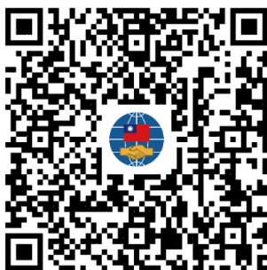
僑委會官網 海外臺商精品專區