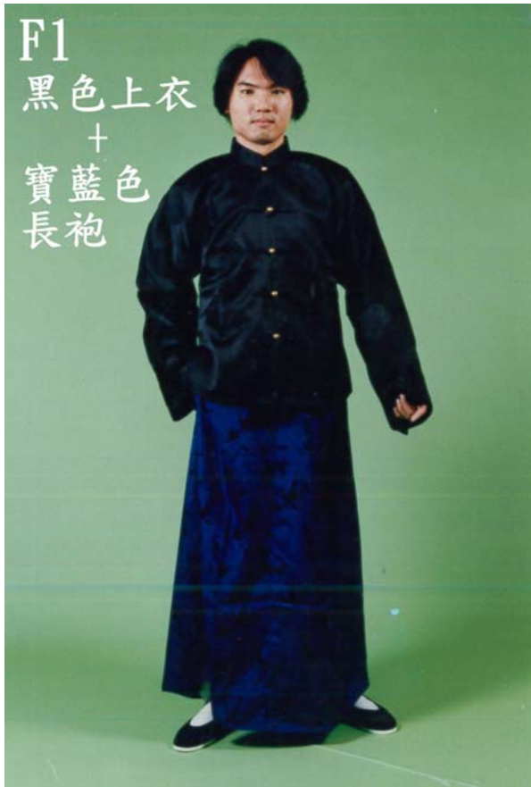
F1 黑色上衣 + 寶藍色 長袍