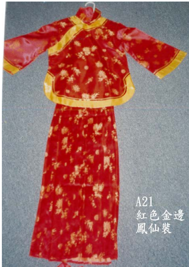
A21 紅色金邊 鳳仙裝