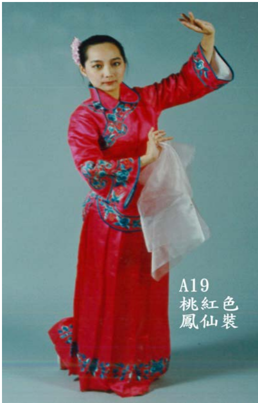
A19 桃紅色 鳳仙裝