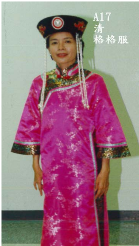
A17 清 格格服