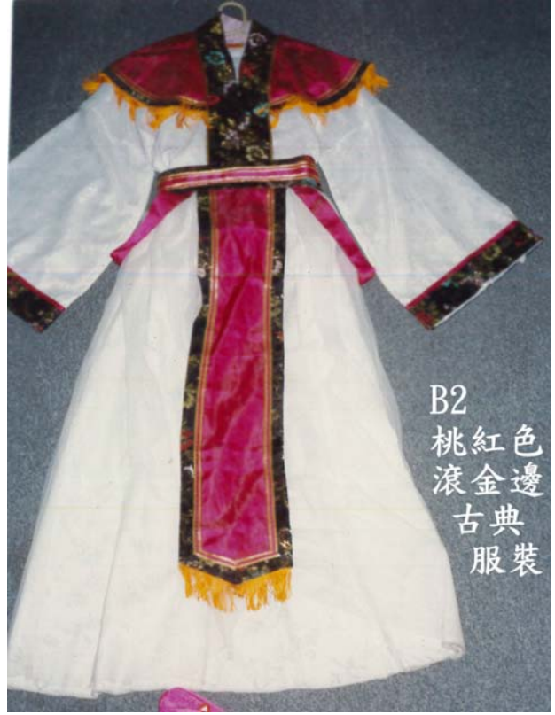
B2 桃紅色 滾金邊 古典服裝