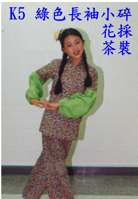
K5 綠色長袖小碎 花採 茶裝