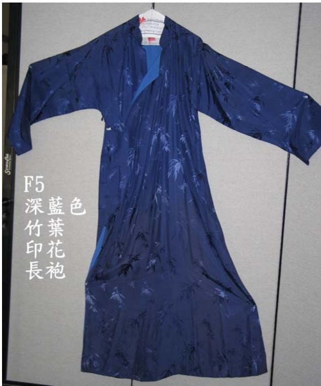
F5 深藍色 藍葉印花 長袍