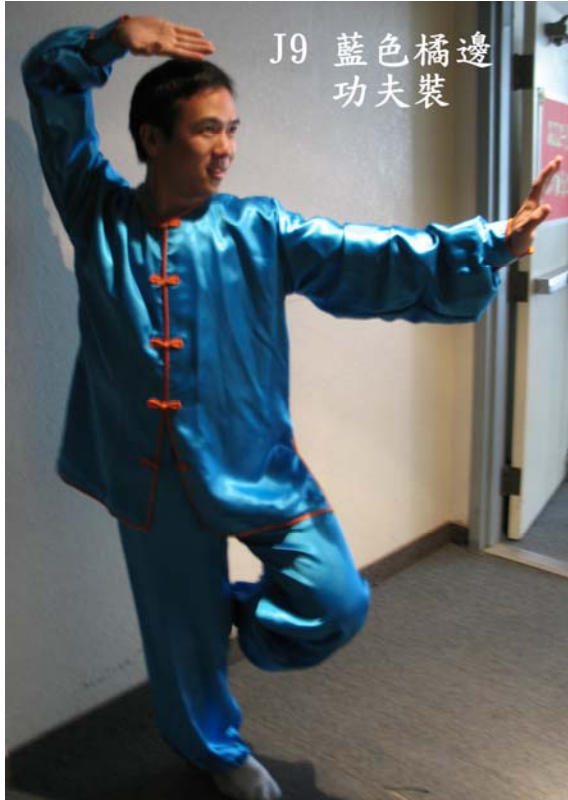
J9 藍色橘邊 功夫裝