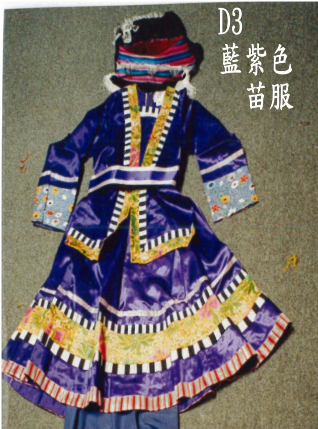
D3 藍紫色 苗服