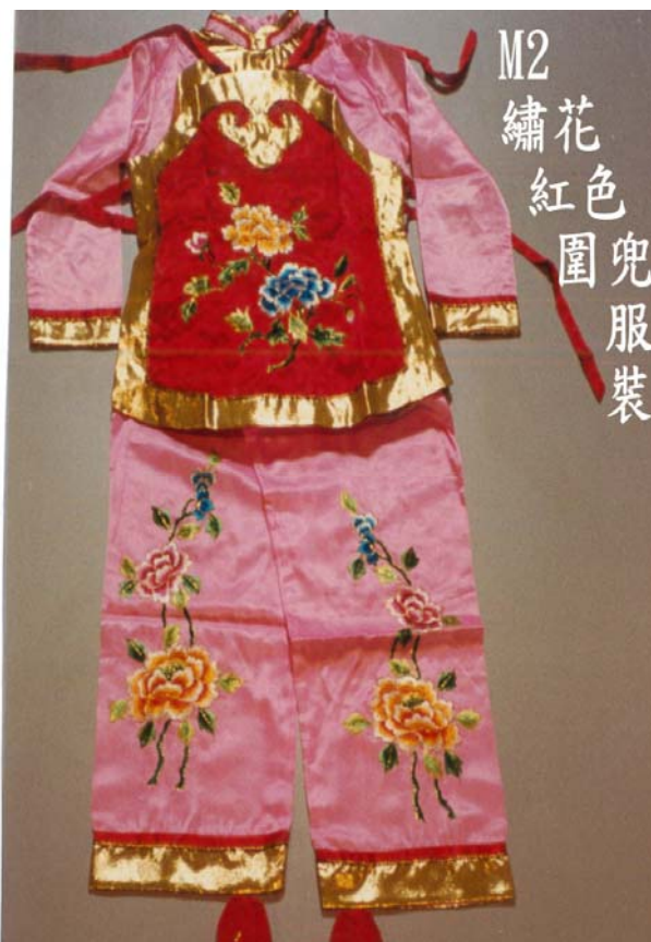
M2 繡花 紅色圍兜 服裝