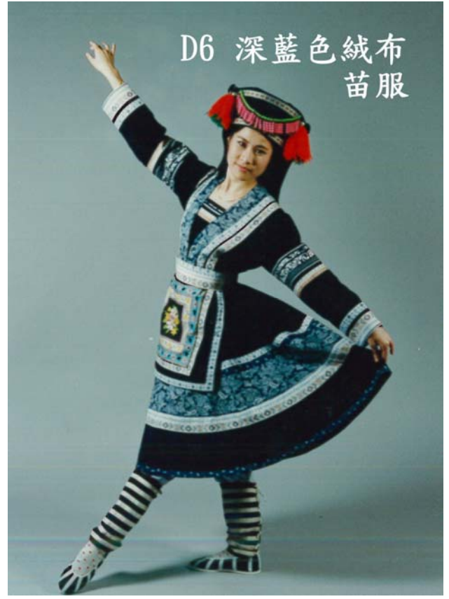
D6 深藍色絨布苗族服