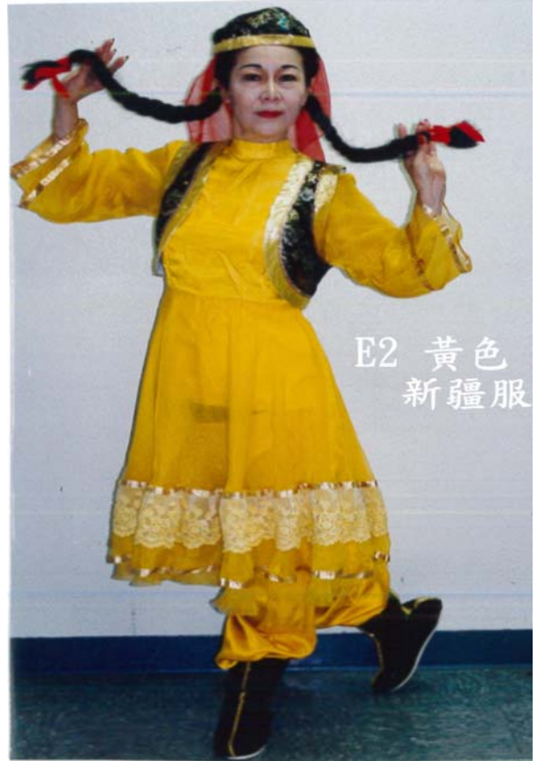
E2 黃色 新疆服