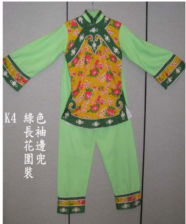
K4 綠色 長袖 花邊兜 圍裝