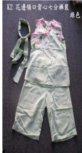
K2 花邊領口背心七分褲裝