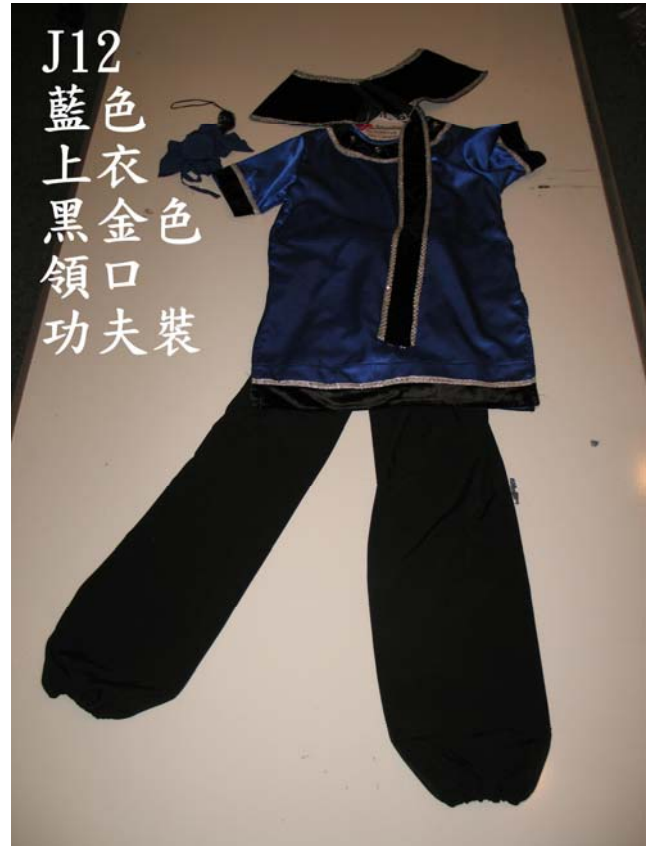
J12 藍色衣 上黑色 領口 功夫裝