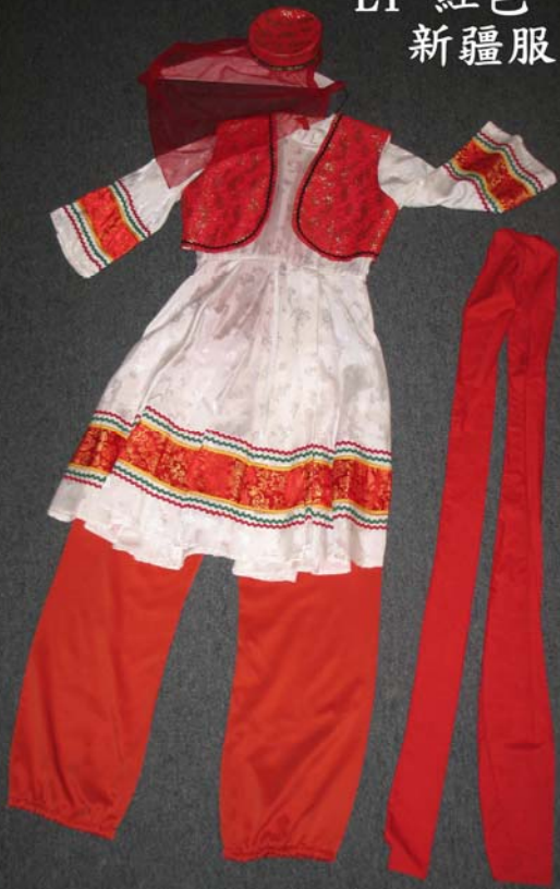
E1 紅色 新疆服