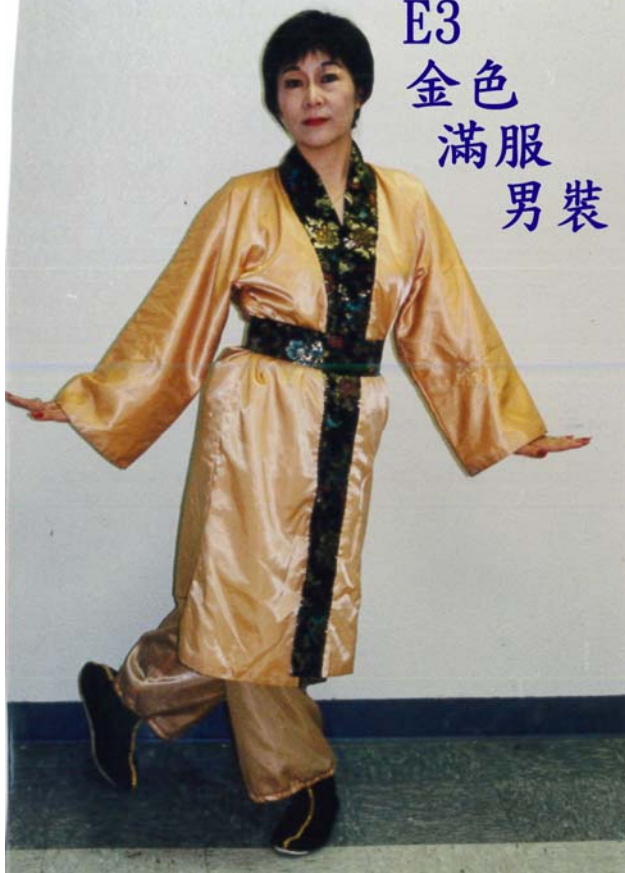
E3 金色 滿服 男裝