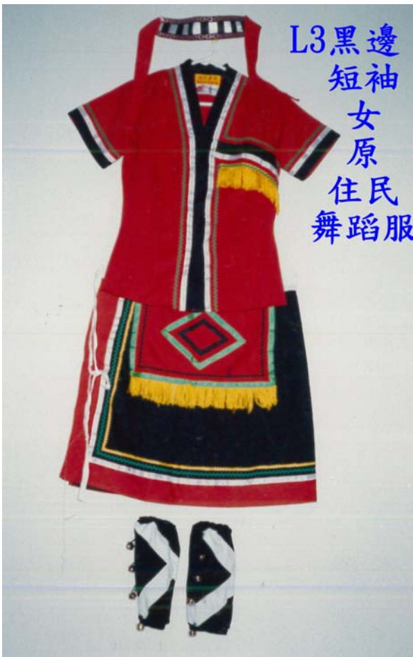
L3 黑邊 短袖 女 原住民 舞蹈服