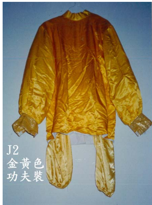
J2 金黃色 功夫裝