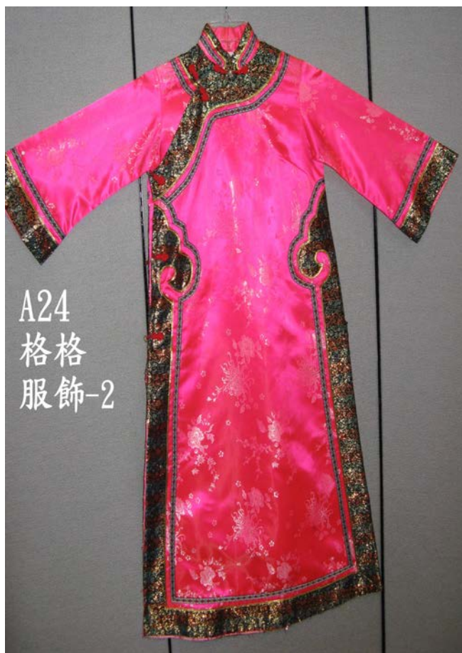
A24 格格 服飾-2