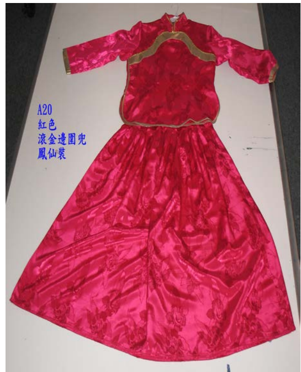
A20 紅色 滾金邊圍兜 鳳仙裝