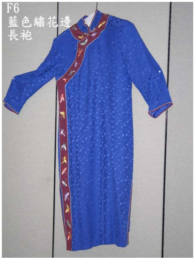
F6 藍色繡花邊 長袍