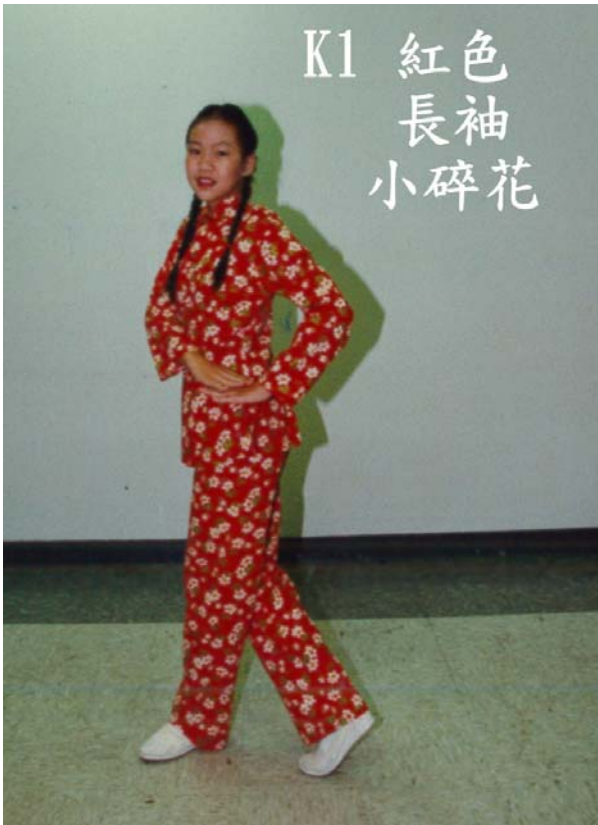
K1 紅色 長袖 小碎花