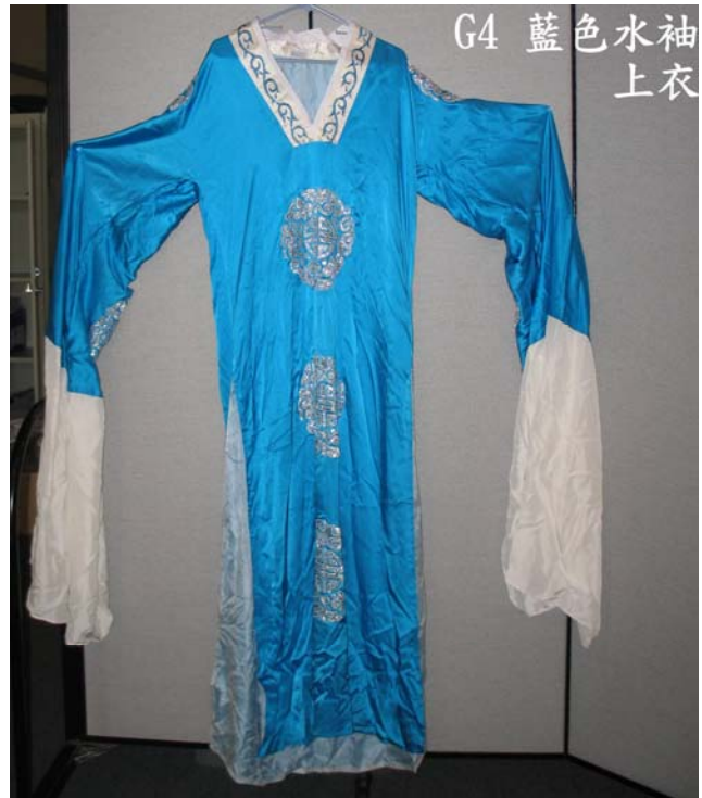
G4 藍色水袖 上衣