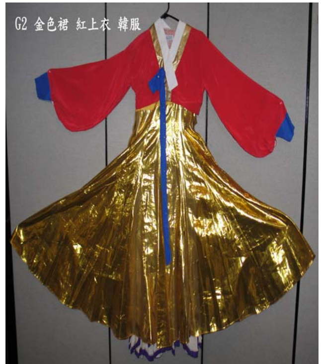
G2 金色裙 紅上衣 韓服