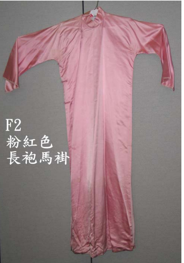
F2 粉紅色 長袍馬褂