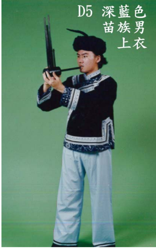
D5 深藍色苗族男上衣