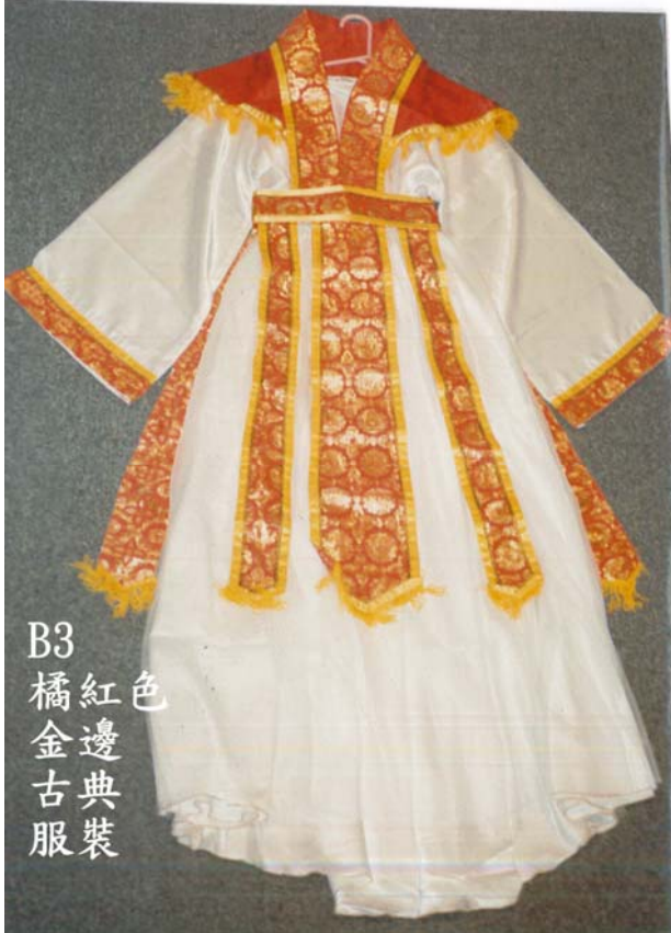
B3 橘紅色 滾金邊 古典服裝