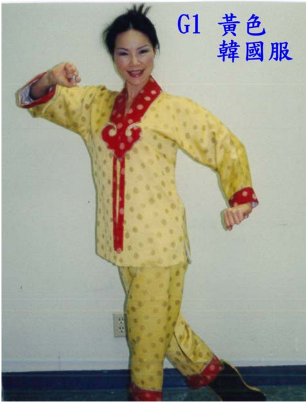
G1 黃色 韓國服