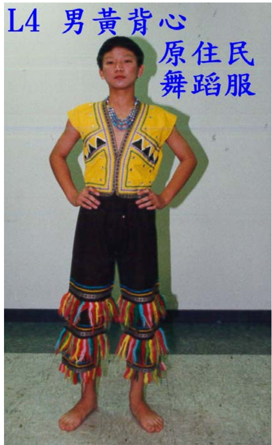
L4 男黃背心 原住民 舞蹈服