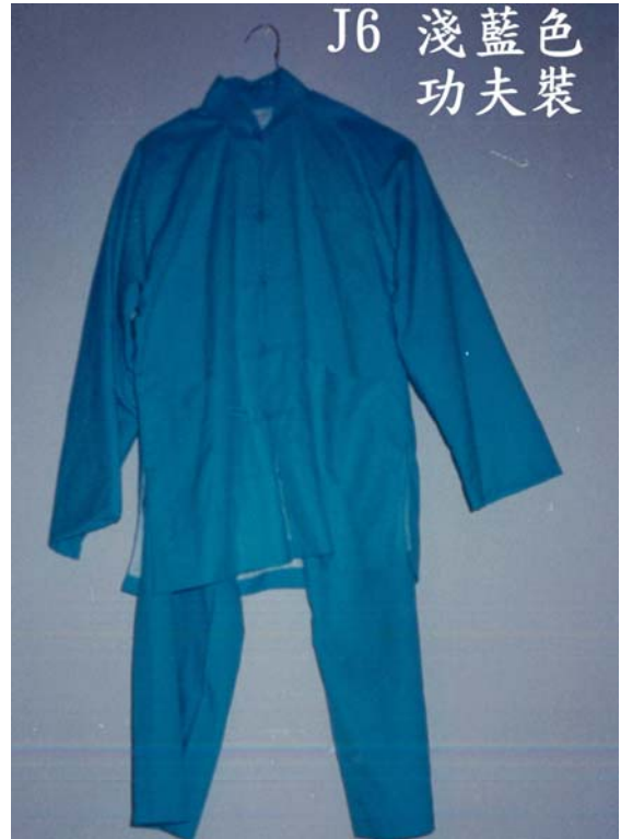
J6 淺藍色 功夫裝