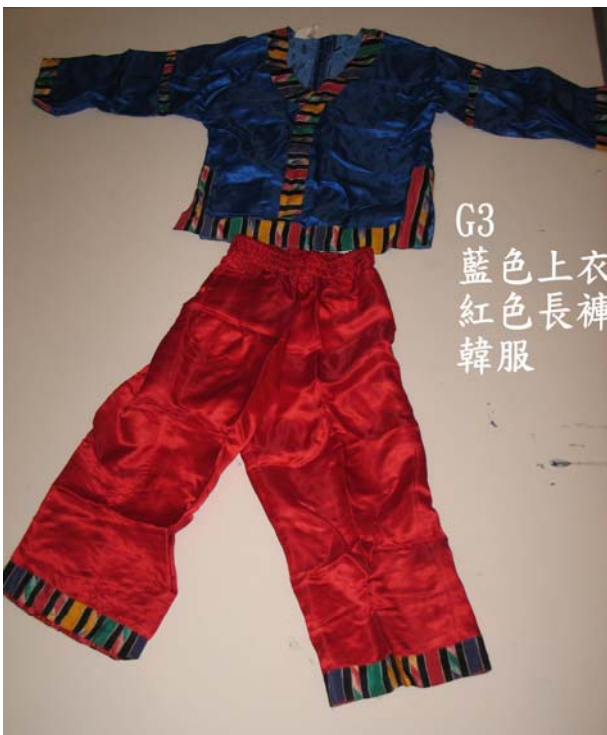
G3 藍色上衣 紅色長褲 韓服