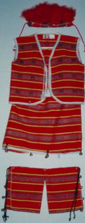
女生 毛織 原住民 舞蹈服