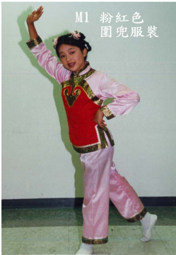
M1 粉紅色 圍兜服裝