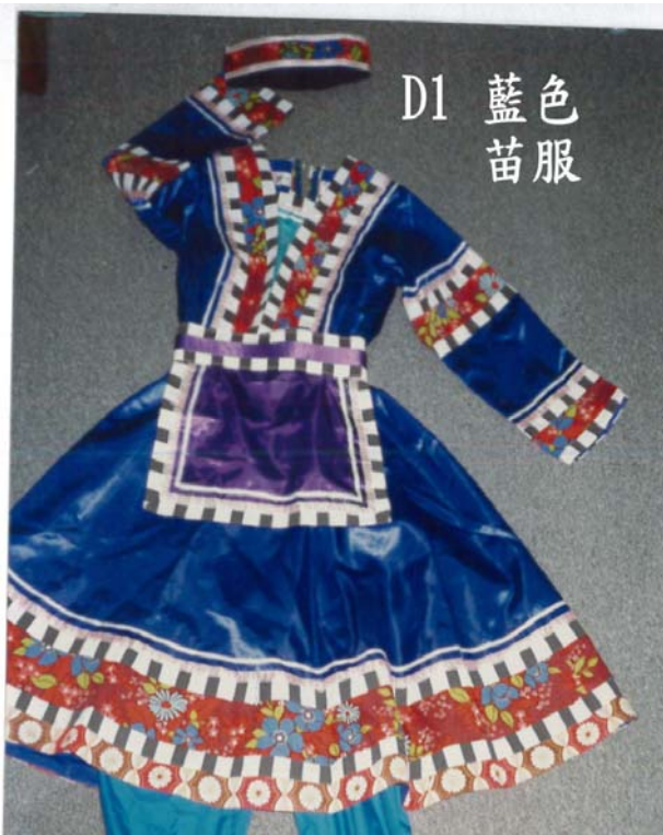
D1 藍色 苗服