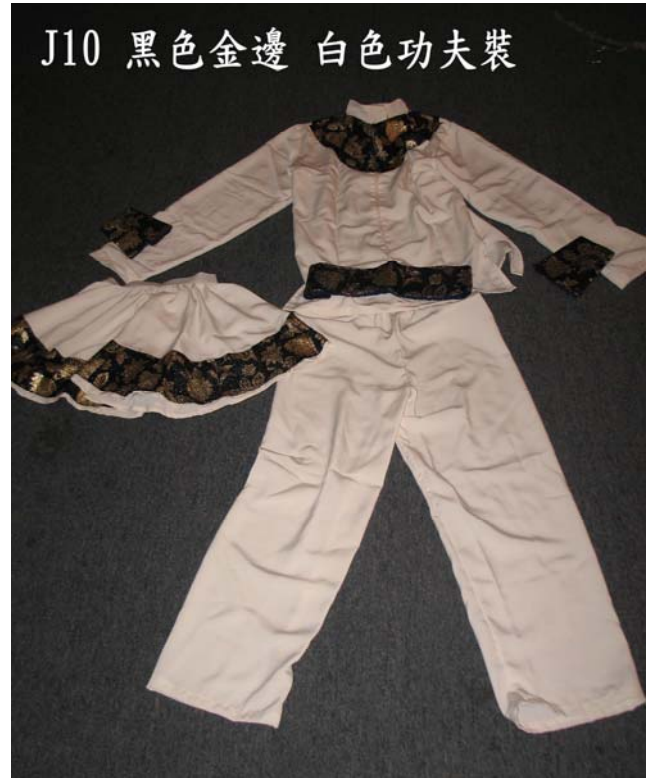
J10 黑色金邊 白色功夫裝