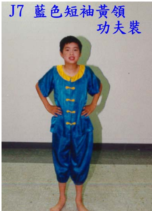
J7 藍色短袖黃領 功夫裝