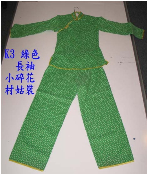
K3 綠色 長袖 小碎花 村姑裝