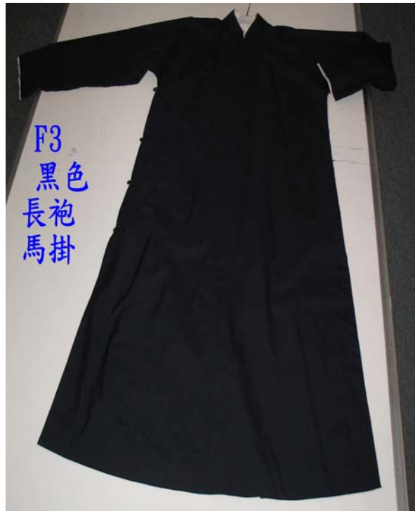
F3 黑色 長袍 馬褂