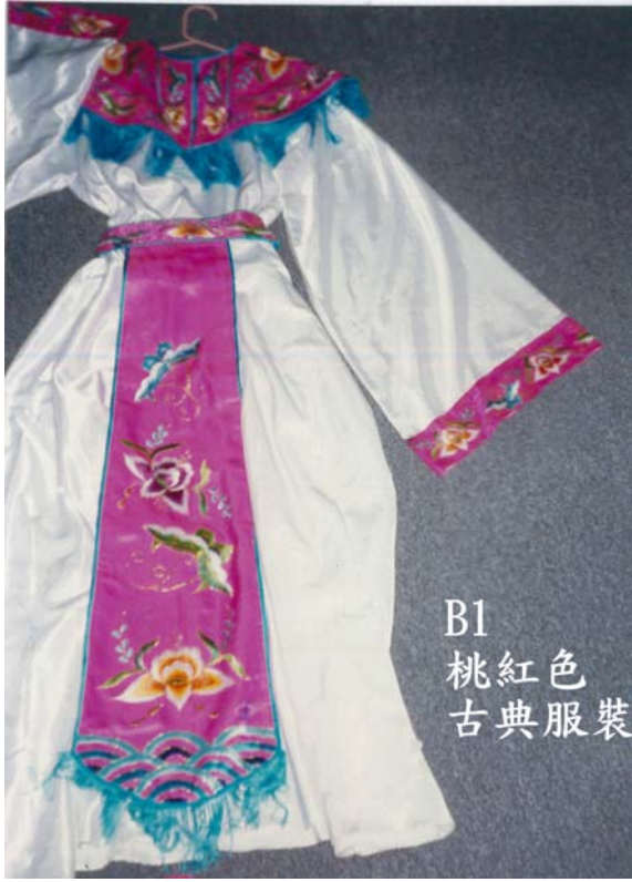
B1 桃紅色 古典服裝