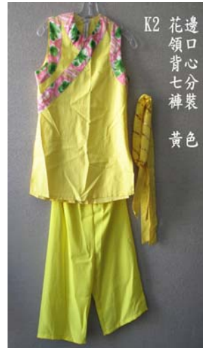
K2 邊口心分裝 花領背心七分褲裝 黃色