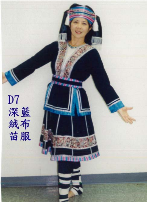
D7 深藍色絨布苗族服