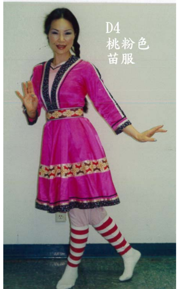
D4 桃粉色 苗服