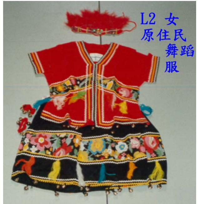
L2 女 原住民 舞蹈服